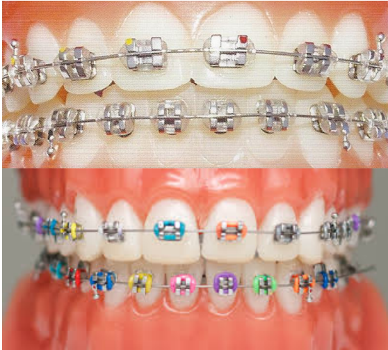
METAL (AVEC OU SANS COULEUR)