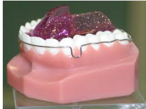
ENVELOPPE LINGUALE NOCTURNE (ELN)