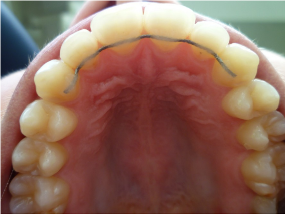
FIL DE CONTENTION