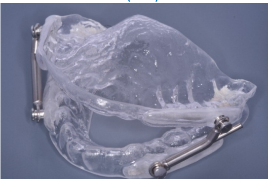
PROPULSEUR UNIVERSEL LIGHT (PUL)