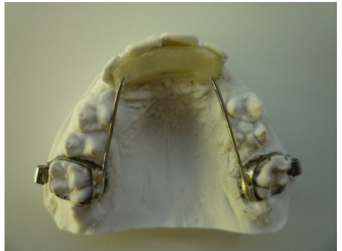
PLAN DE MORSURE RETRO-INCISIF (RTA)