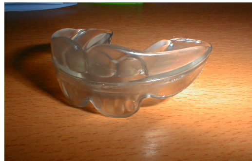
EDUCATEUR FONCTIONNEL (EF2 EF3...)